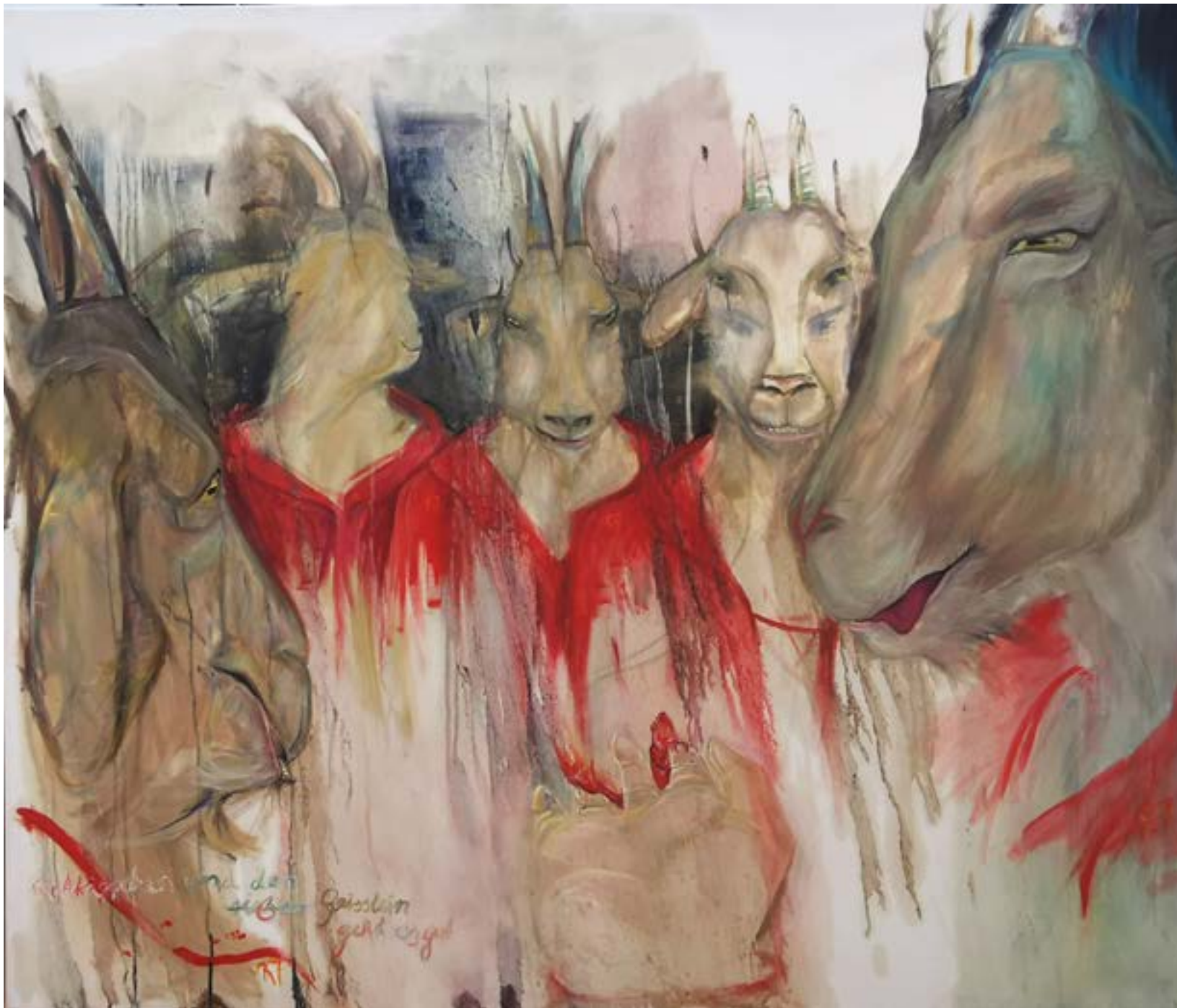
Rotkäppchen und die sieben Geisslein Öl auf Leinwand 140 x 120 cm 2024 Teil der Serie – Red 7