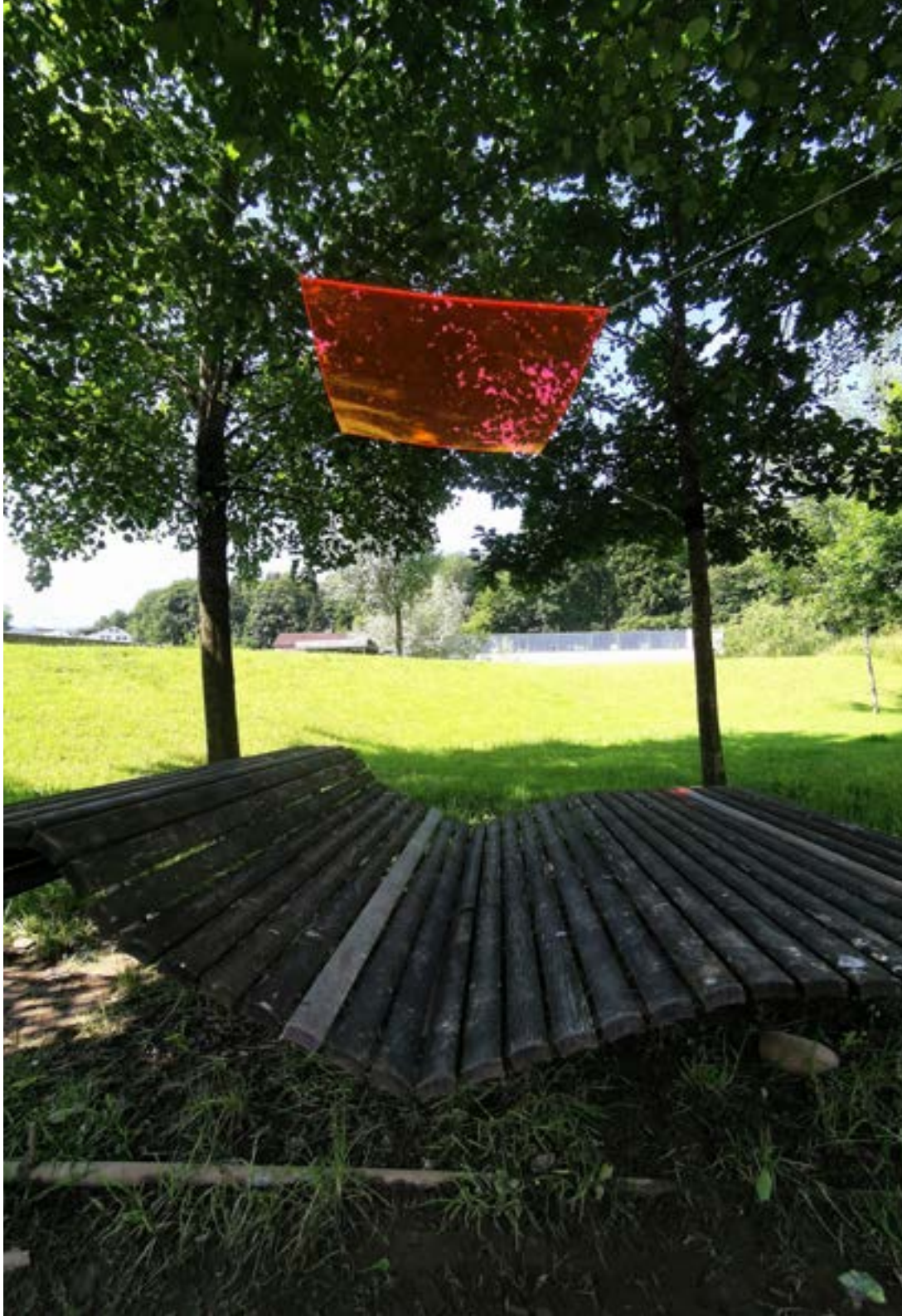
TagNacht Fenster Orange Carmen Kaufmann und Regina Schwegler Plexiglas-Scheibe in Holzrahmen 170 x 100 cm 2024 Projektarbeit des Moduls Kunst im Fluss