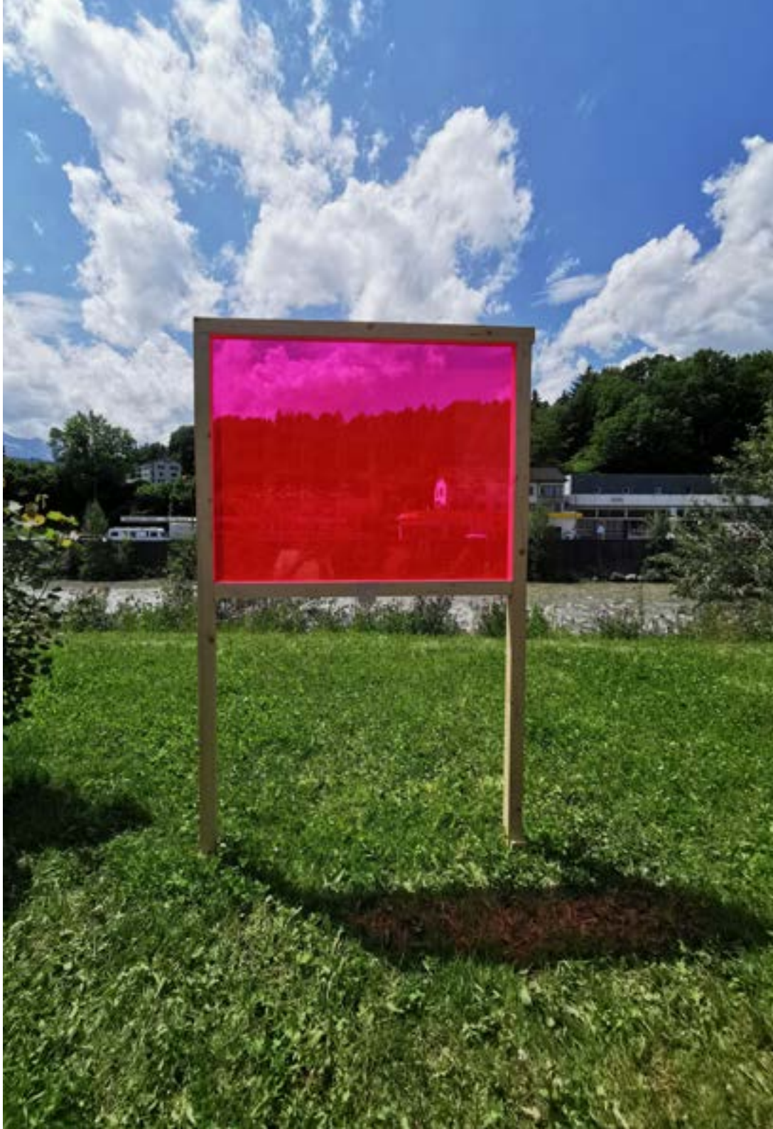
TagNacht Fenster Rot Carmen Kaufmann und Regina Schwegler Plexiglas-Scheibe in Holzrahmen 170 x 100 cm 2024 Projektarbeit des Moduls Kunst im Fluss