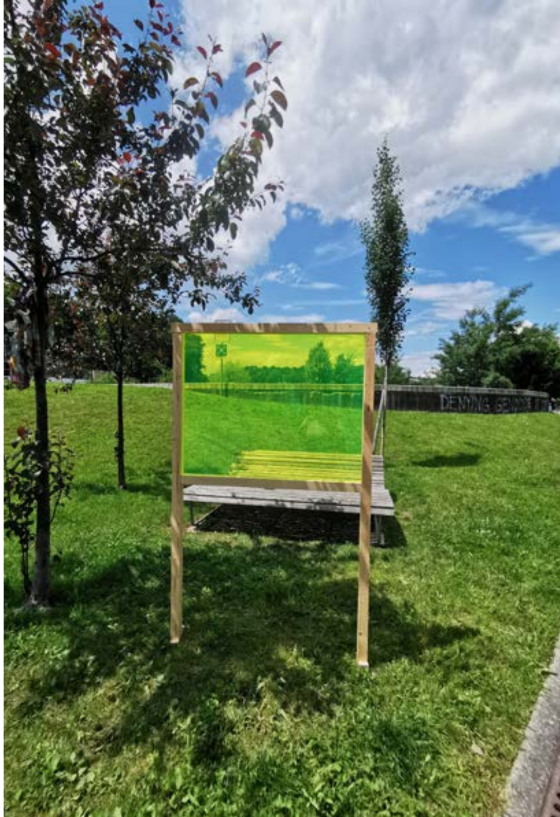
TagNacht Fenster Grün Carmen Kaufmann und Regina Schwegler Plexiglas-Scheibe in Holzrahmen 170 x 100 cm 2024 Projektarbeit des Moduls Kunst im Fluss