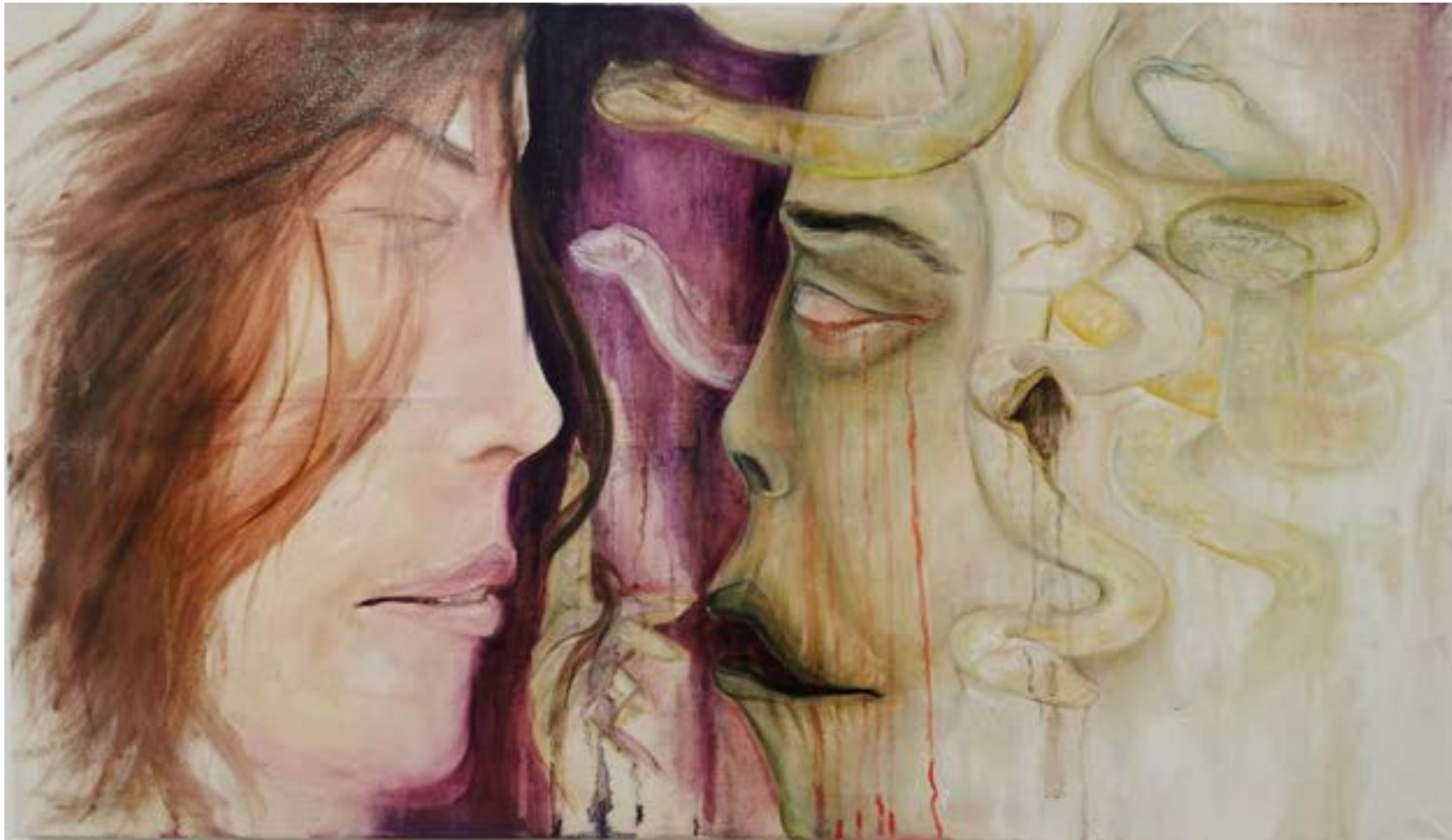
Der Traum Öl auf Leinwand 120 x 70 cm 2024 Teil der Serie – " Schau ihr nicht in die Augen!"