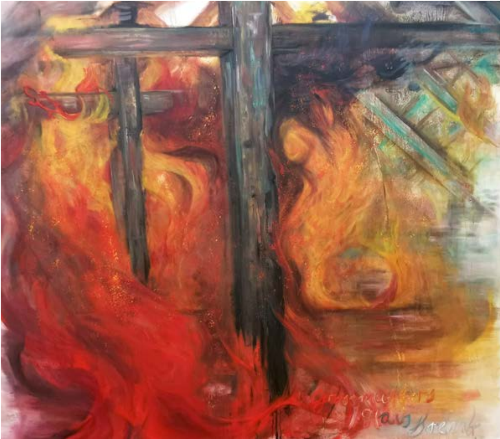
Großmutter's Haus brennt Öl auf Leinwand 140 x 120 cm 2024 Teil der Serie – Red 7