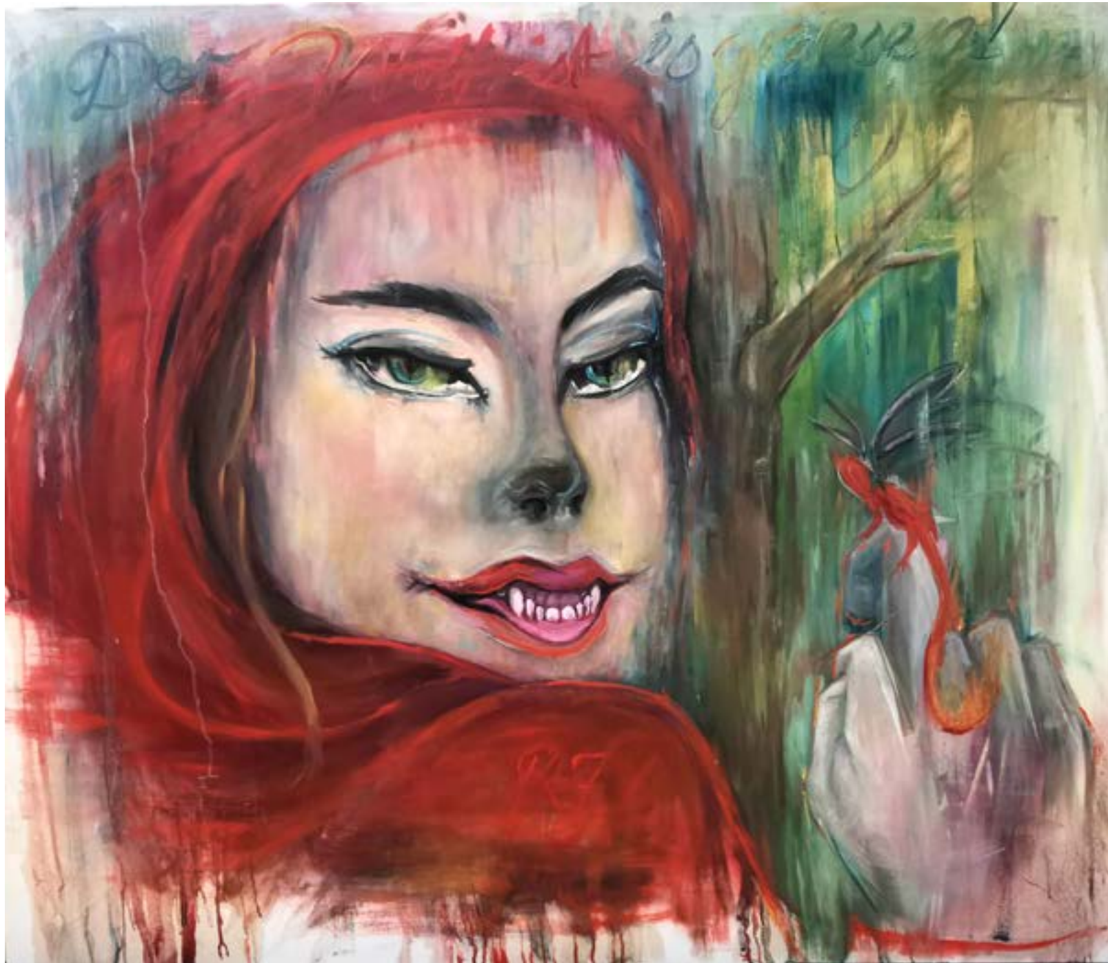
Der Wolf ist es gewesen Öl auf Leinwand 140 x 120 cm 2024 Teil der Serie – Red 7