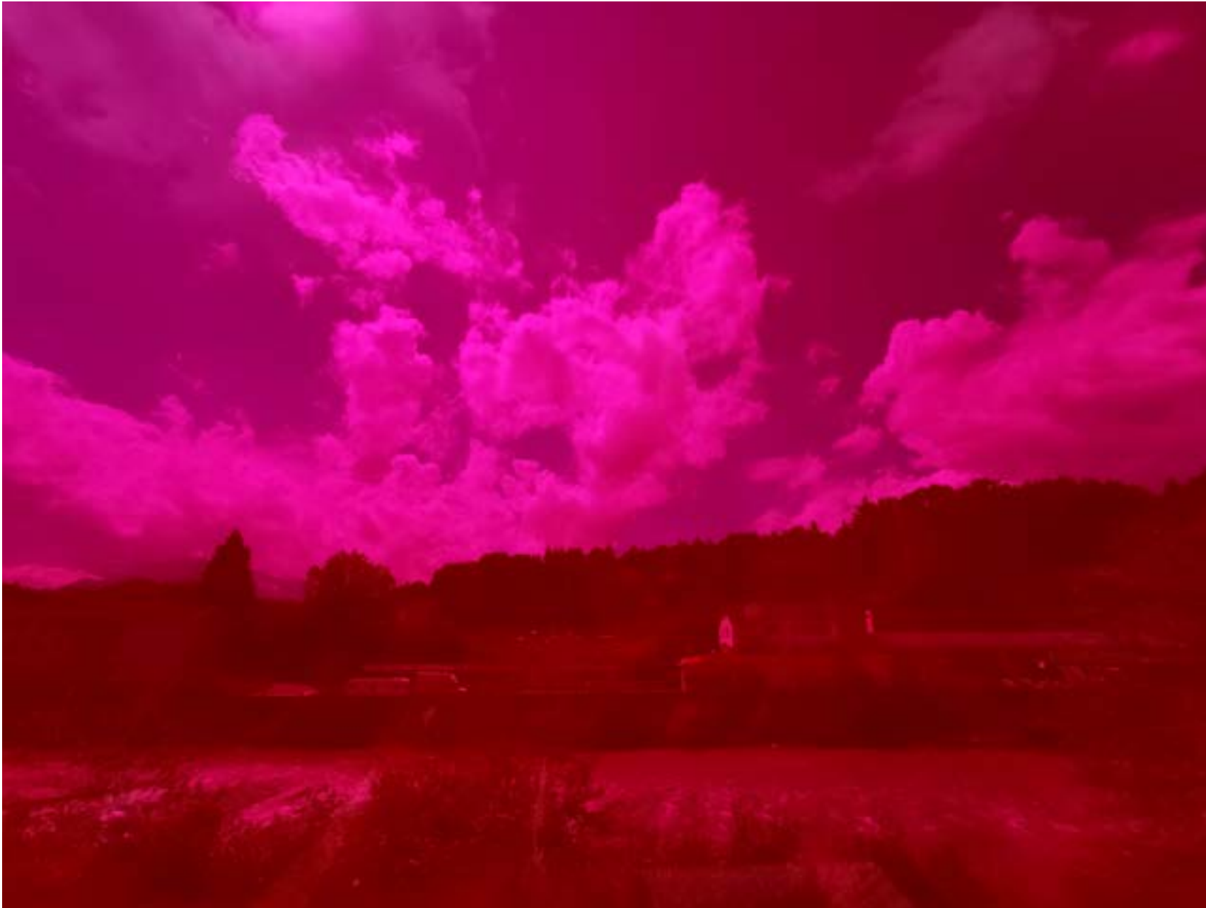
TagNacht Sound Rot