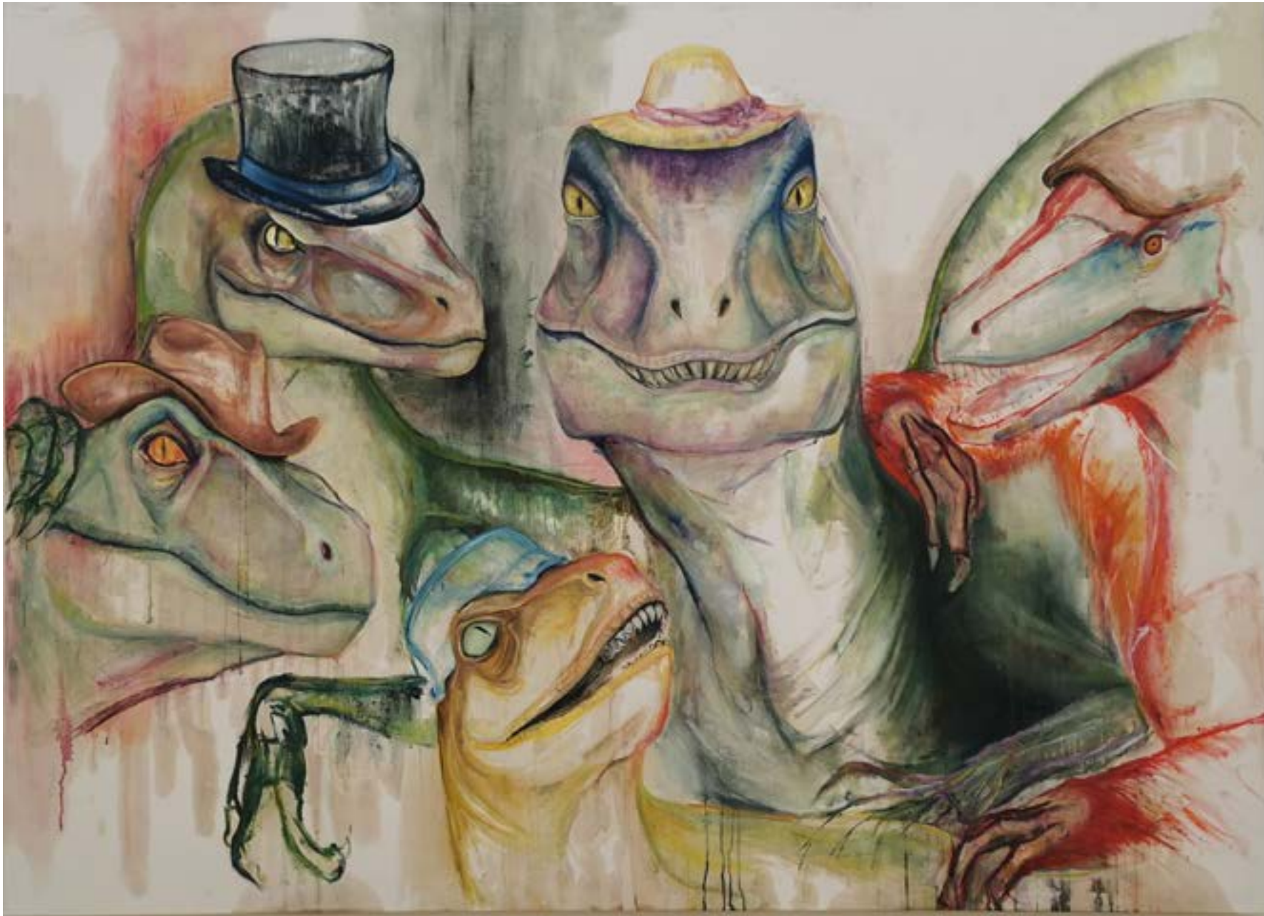
Raptoren mit Hüten Öl auf Leinwand 200 x 145 cm 2024